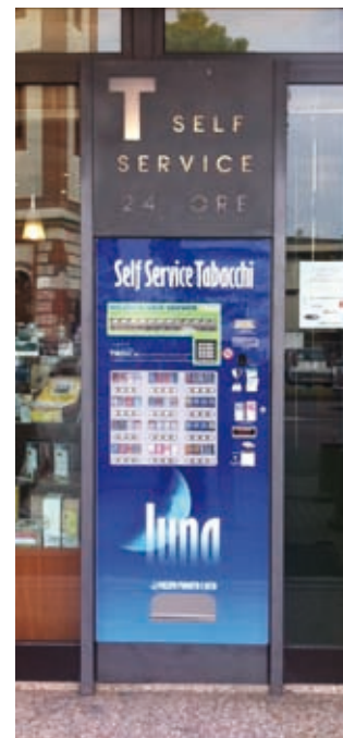
INSTALLAZIONE A VETRINA